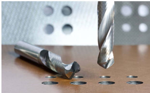
Abbildung 1: PKD-Spiralbohrer von LACH DIAMANT

Sparen Sie sich das Pilotieren und Vorbohren: Die von LACH DIAMANT entwickelten und langzeit-erprobten PKD-Spiralbohrer erfüllen höchste Ansprüche bei der Bearbeitung von GFK, CFK, Graphit, Grünkeramik und NE-Metallen.