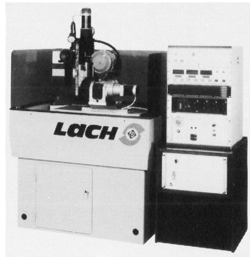
Abbildung 1 Gesamtansicht der Lach-pkd-Diamantschleifmaschine Baureihe M

Lach-Vertriebs GmbH, Donaustraße 17–21, D-6450 Hanau 1, Telefon 061 81/103-02