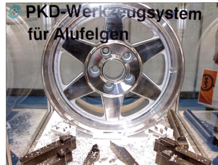
▲ PKD dreborid-Werkzeugsystem für Aluminiumfelgen (80er Jahre).

Ein sogenanntes »Mikrofinish« an den Freiflächen der polierten Diamant-Schneiden ist der Garant für eine überragende Schnittqualität und langer Standwege. Somit erfüllen die neu entwickelten Diamant-Fräser höchste Ansprüche und schaffen die beste Voraussetzung für die »Laserkante« –